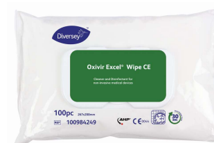
Oxivir Excel Wipe CE Dispositivos Médicos