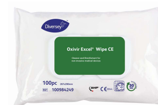
Oxivir Excel Wipe CE Desinfetante